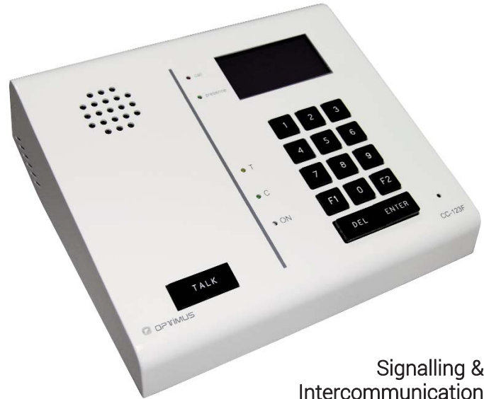
Signalling & Intercommunication