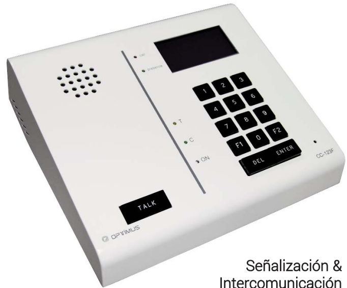
Señalización & Intercomunicación