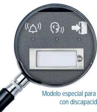
Modelo especial para personas con discapacidad