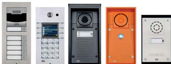
2N® Helios IP Verso